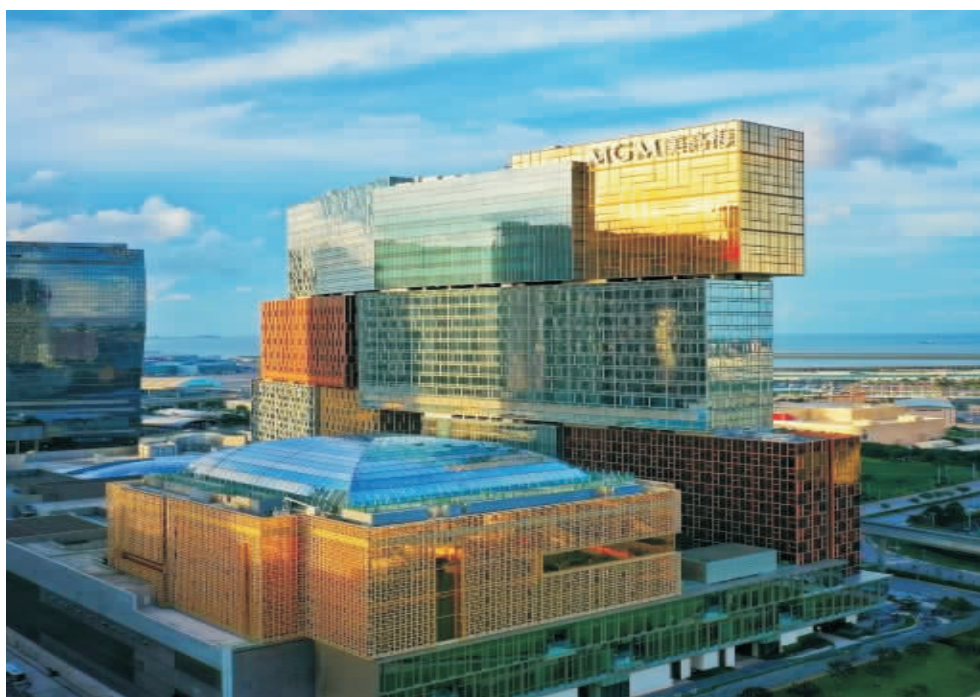
圖 1 美獅美高梅酒店(澳門氹仔)

心獨運，尤其在澳門美高梅及美獅美高梅兩個項目，傾注原創設計意念。項目獲多項國際建築及綠色殊榮，包括大灣區首家及澳門唯一一家囊括中國綠色建築三星級設計標識和運行標識的巨型綜合建築及酒店，以及健力士世界紀錄，全球最佳摩天大樓獎項等。仿如珠寶盒的設計，從外型到內部裝修，本身已是件標杆的藝術作品，引人入勝（見圖 1）。在每一個角落，我們都運用藝術元素，以多種手法及界面演繹文化藝術，並讓數百件訂製的當代藝術藏品，遍佈我們的公共空間，把文化藝術鑑賞放在一個輕鬆自如的環境下，享受在我們精心提煉及布局下所呈現的文化氛圍，讓旅客創造自己的旅遊路線及感受前所未有的文旅體驗。