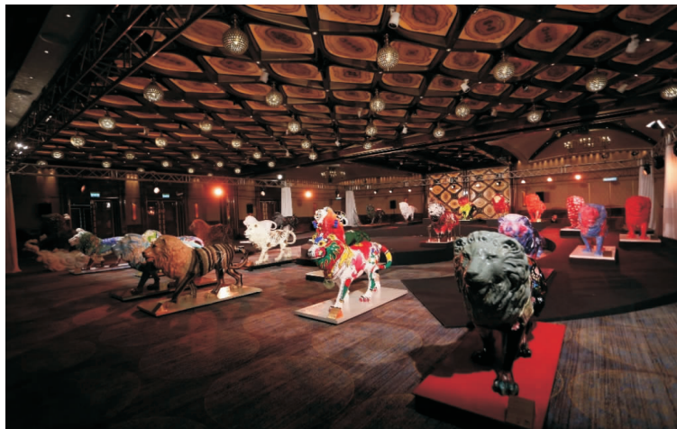
圖 3 澳門美高梅《獅子雙年展》

獅子雕塑成為我們的國際友誼大使，在各公眾空間展出，有部分更出訪“一帶一路”沿線的國家作文化交流，讓更多人知道和認識澳門現在的藝術氛圍及成熟水平（見圖 3）。我們的文旅活動已達至一方傳承，一方創意，兩者結合，用藝術作為人類共同體的重要理解。