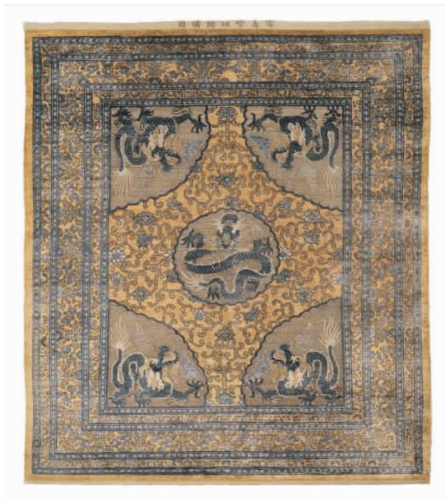
圖 5 清乾隆年間御製地毯《龍翔九天》(美獅美高梅)

乾隆年間，其龍、花及雲等圖案以絲綢和鍍銅線編織而成，設計複雜、手工精巧，可領略中國地毯鼎盛時期宮廷藝術的工匠精神。