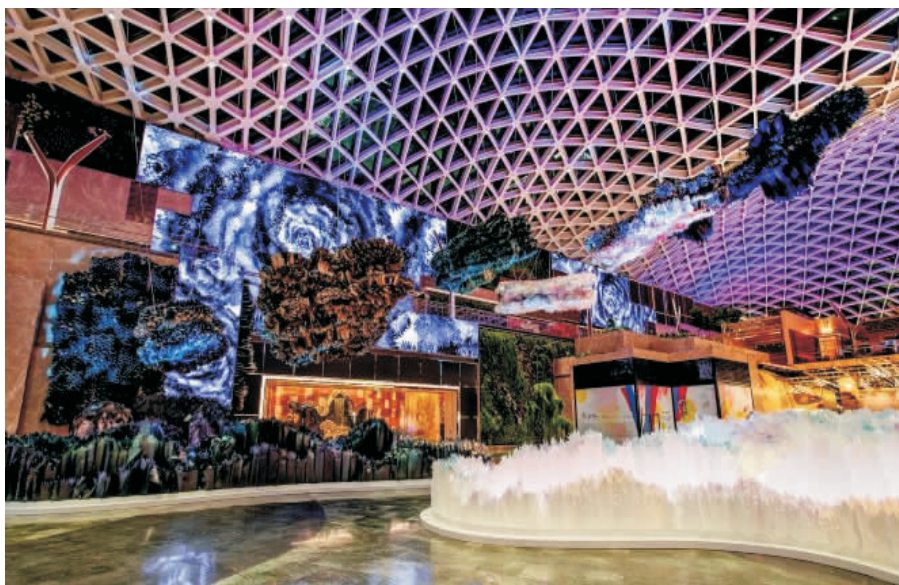
圖 7 立體化與數字化的水墨藝術:《華源》(美獅美高梅)

以環保、可持續、自然、雕塑、虛擬形式的三重山水庭園融合成大型多媒體裝置藝術,讓觀眾置身其中,成為立體山水畫意境的一部分,為大家帶來非一般的藝術體驗。這亦是美高梅開澳門數碼科技文化的先河,將現代科技及創新融合、注入及加以運用,開展了以蛻變及革新的大膽嘗試,來傳承中華傳統藝術的新里程。