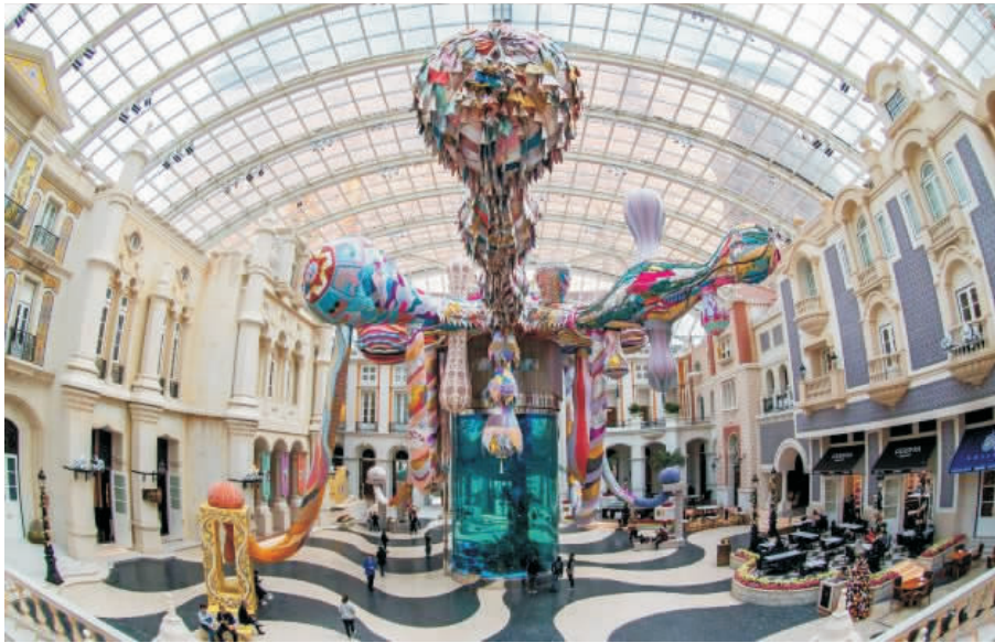
圖 6 葡萄牙藝術家瓦思康絲勒的《八面靈龍》(澳門美高梅)

2019年,為隆重慶祝國慶70周年及澳門回歸20周年的重要雙節慶日子,我們以象徵五千年中華文明的“水墨藝術”為主題,特別邀請了兩位才華橫溢的中國藝術家馬文女士及楊泳梁先生,分別在美獅美高梅的視博廣場及美高梅劇院,把我們的大膽創意付諸實行,創造了一個立體化與數字化的水墨藝術展:《華源》(見圖7)。展覽重新定義水墨作品,以嶄新方法結合數字科技,