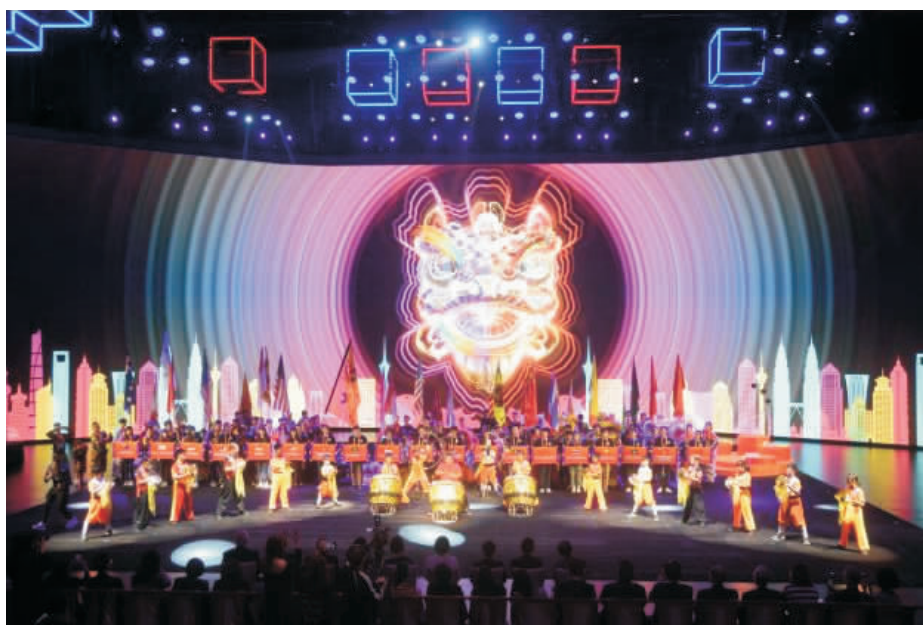
圖 8 美高梅《獅王爭霸》澳門國際邀請賽

8）及“美高梅幼獅訓練計劃”，不僅可實現非遺文化有效傳承，還在教育、培育下一代對中華文化歷史重要性的認知，提升中華文化在全球文化藝術的影響力都有著顯著作用。同時，通過結合傳統體育、現代賽事及演出手法，推動文旅融合品牌化發展，拓展文旅融合新空間，以至實踐一些品牌培育項目，都是我們探索推進文旅融合 IP 工程，用原創 IP 講好中國故事，打造文旅新業態的發展進程。