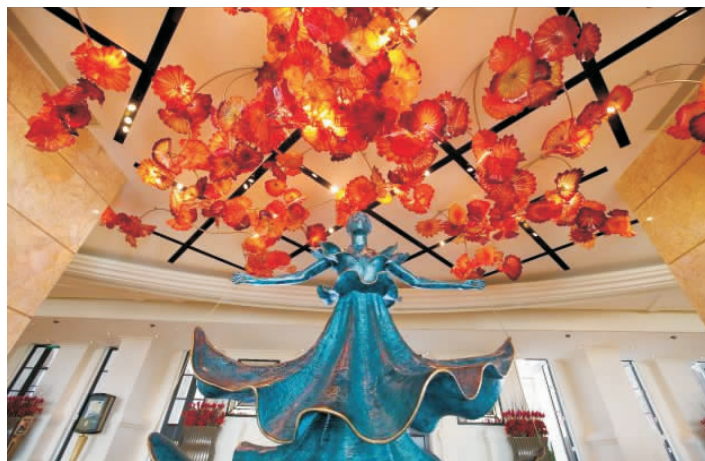
圖 4 天花板的玻璃花朵及超現實主義大師達利的雕塑《達利的舞者》（澳門美高梅）

據我們酒店的氣質及品牌的定位，專門設計及訂製了酒店接待大堂的巨型玻璃畫及天花板的玻璃花朵。這些玻璃作品，完全人工吹製，展現工匠的高度技巧水平，配合在大堂中央的著名超現實主義大師達利的雕塑作品——《達利的舞者》，讓美高梅的大堂宛如演藝廳！（見圖 4）