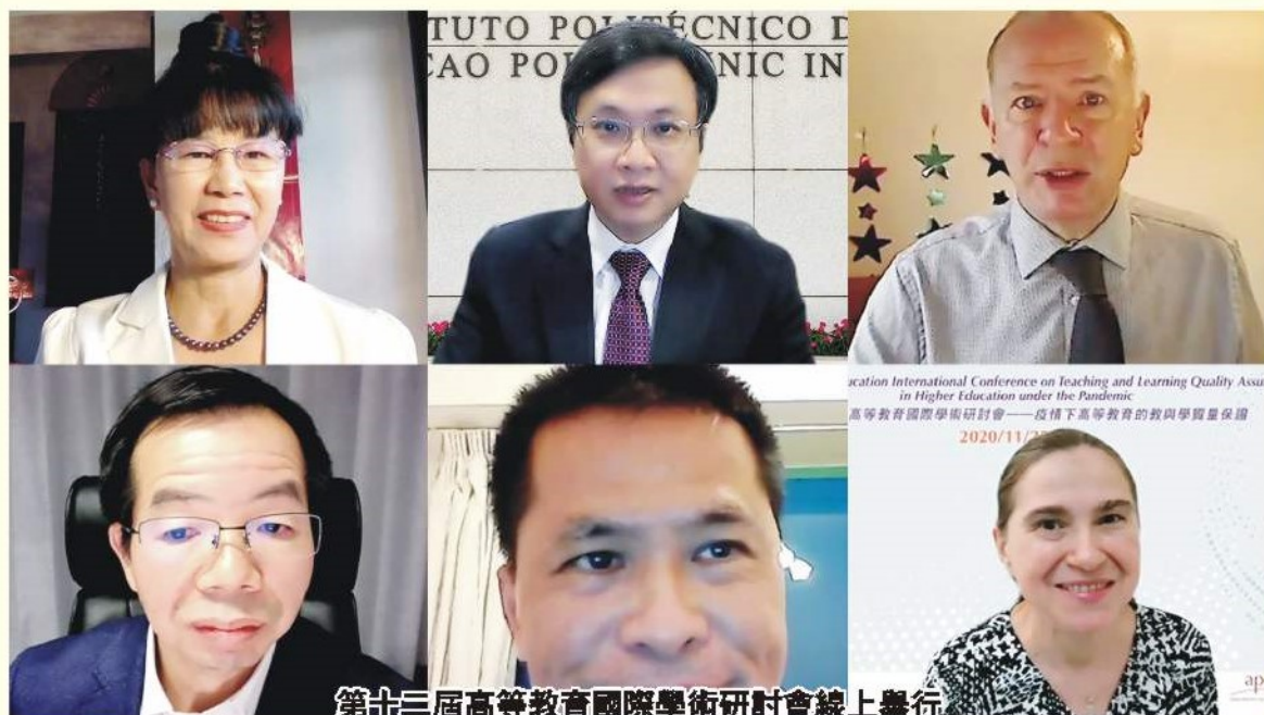
第廿三屆高等教育國際學術研討會線上舉行